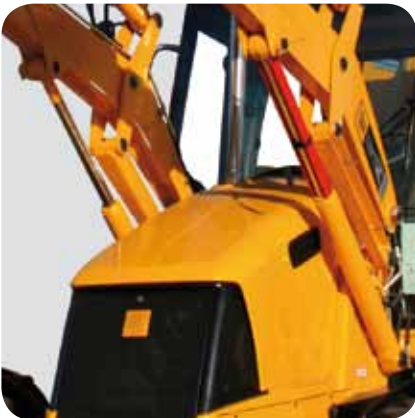
autonkorien, hyttien saumaukseen...