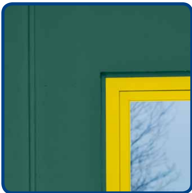
Saumaus ja kittaus sävy sävyyn julkisivun ja ikkunapuitteiden kanssa