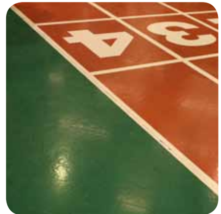
urheiluhallien muovimattojen saumaukseen...