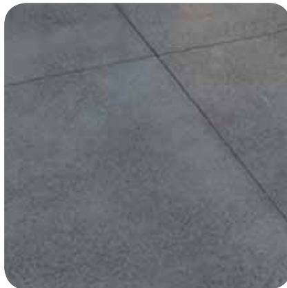
tasoitettujen lattioiden ja maalattujen lattialevyjen saumaukseen... Myös lattian ja seinän välisiin saumoihin lattialistan sijasta.